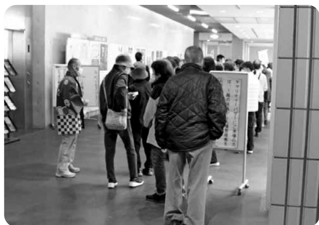
開始前の行列風景