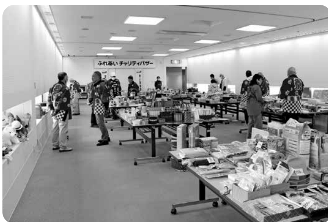
ボランティアさんの最終確認

毎年恒例の福祉ふれあいチャリティーバザーを12月7日(日)に開催しました。今年度は終了時刻を14時までとしたり、野菜売場や出店コーナーを復活させたりとコロナ禍前の規模に戻して実施しました。お蔭様で143名の方にご来場いただき、地域の皆さまからご提供いただいた品物を購入していただきました。バザーの収益金189,510円は江津市共同募金委員会へ寄付し、市内で取り組まれる福祉活動に役立てられます。この度のバザーにあたり、品物を提供していただきました市民・団体の皆様、出店にご協力いただいた皆様、ボランティアとしてお手伝いしていただいた皆様、全ての方々に厚くお礼申し上げます。