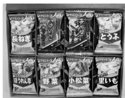
江津市内の保育園児、児童、生徒によるメッセージカード付見舞品