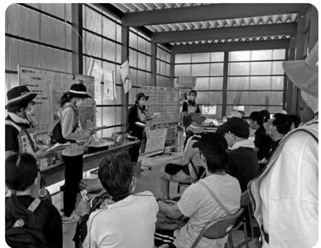
ボランティアに事前説明をしている様子

この度、島根県・市町村社会福祉協議会における災害時支援協定に基づき、本会から能登町災害ボランティアセンターへ職員1名が派遣されることになり、6月15日から21日までの1週間、石川県鳳珠郡能登町へ赴きました。能登地域に入ってから、崩れた道路や倒壊した建物等を目の当たりにし、被害の大きさに衝撃を受けました。能登町災害ボランティアセンターは本部の他に2つのサテライト（本部以外の拠点）が設置されており、その一つである柳田地域のサテライトに松江市社協の方1名と広島県の社協の方2名と共に4名で入りました。業務は、ボランティアの受付、ボランティアの当日の活動場所を調整するマッチング、活動依頼場所に赴いて何名のボランティアが必要か等の確認をする現地調査、困りごとがないか地域の方に声掛けをするニーズの掘り起こし等で多岐に渡りました。地震発生から約半年が経過していましたが、新たな依頼が入ったり、未完了の依頼が残っていたりと、まだまだ時間を要しそうな状況でした。この度の貴重な経験は、今後の災害支援活動に活かしていきたいと思っています。被災された方々の1日でも早い復旧・復興をお祈り申し上げます。