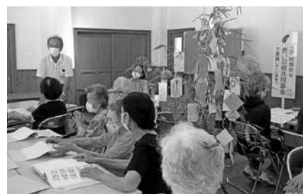
本町支会 ニコニコ給食七夕会

赤い羽根共同募金は、一言では簡単に説明できない地域の困りごと(福祉課題)の解決を図る活動にも心を配って応援する募金です。