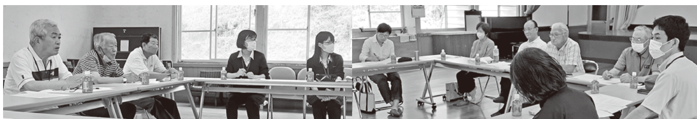
黒松こまりごと救援隊との情報交換会の様子