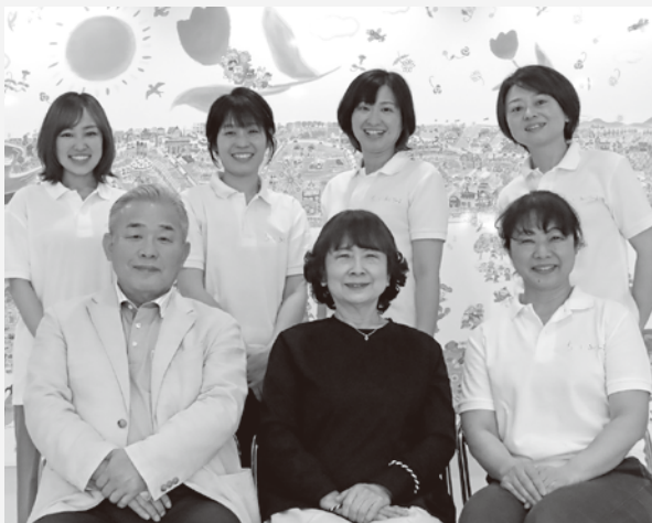
江津市子育てサポートセンター職員のみなさん

さまざまな取組みをする上で大切にしていることは、行政、子育て支援関係機関をはじめ、熱意ある地域の方々とながら、連携して地域全体に広がる支援体制をつくることです。