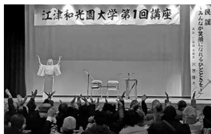
和光園ふれあい講座の様子