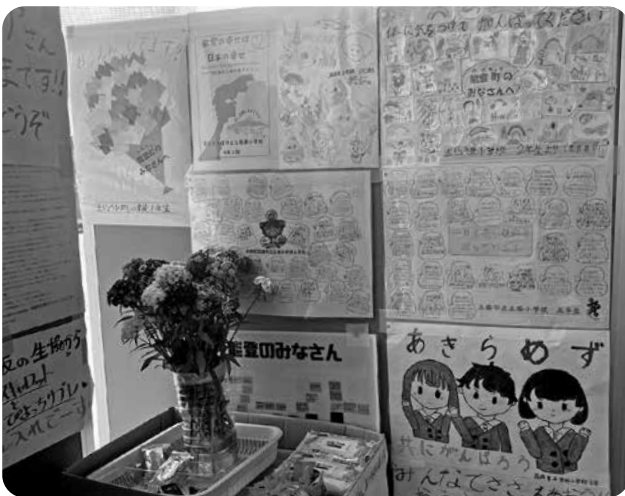
全国から届いたメッセージ